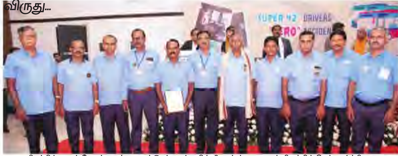
விபத்தில்லாமல் பேருந்து ஓட்டிய ஓட்டுநர்களுக்கு தில்லி கான்ஸ்டிபிள்டுஷன் கிளப்பில் செல்வாய்க்கிழமை மத்திய சாலை போக்குவரத்துத் துறை சார்பில் நடைபெற்ற விருது வழங்கும் விழாவில் விருது பெற்ற தமிழ்நாடு அரசுப் பேருந்து ஓட்டுநர்கள்.